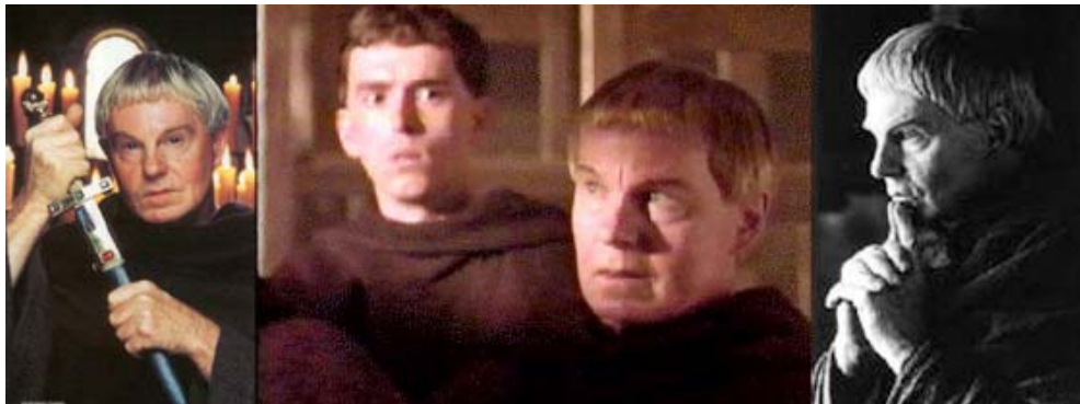
Derek Jacobi caracterizado como Fray Cadfael en la popular serie de la BBC